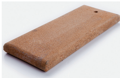
Пробковая доска Используется для выдавливания пузырей и лучшего приклеивания покрытия.