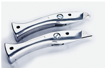
Нож «Дельфин» Для резки эластичных напольных покрытий.