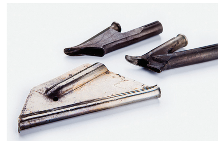
Насадка 5 мм зауженная Для сварки ПВХ покрытий.