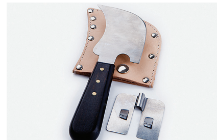
Месяцевидный нож с насадкой Используется для подрезки сварочного шнура. Насадка позволяет осуществлять предварительное обрезание сварочного шнура, защищая напольное покрытие.