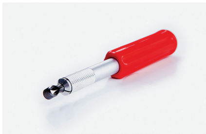
Резак для подрезания с обратной стороны Позволяет подрезать сварочный шнур в углах.