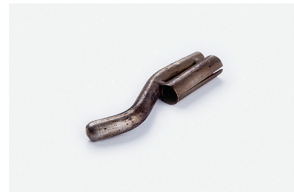
Ремонтная насадка Для обработки шнура в углах.