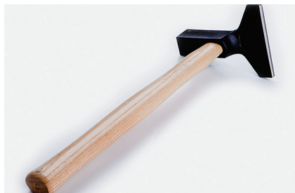
Кромковтирочный молоток, цельнокованный Используется для выдавливания воздушных пузырей и лучшего приклеивания покрытия. Особенно полезен рядом со стенами и на стыках.