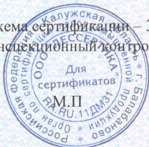
Схема сертификации – Зс. Инспекционный контроль – октябрь 2021 года, октябрь 2022 года.